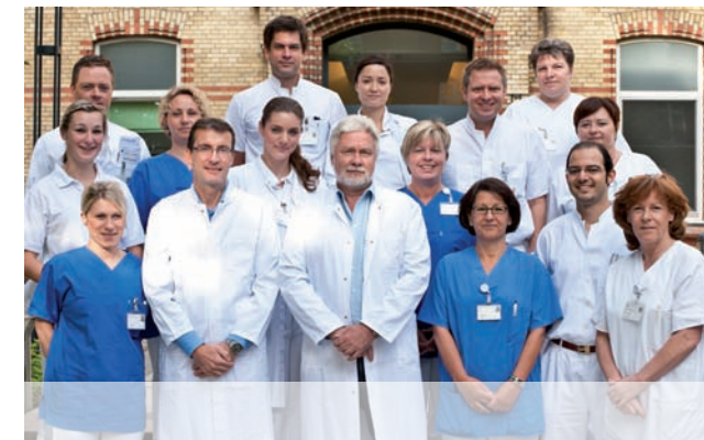
Das Team des Kopf-Hals-Zentrums

Telefon 040 / 25 46 - 23 88 E-Mail schaefer.hno@marienkrankenhaus.org